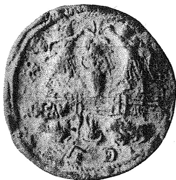
Figure 2: Empreinte sur argile d'un sceau circulaires historié. \varnothing = 4,5 cm. Au centre, la déesse Lakshmi debout de face arrosée par deux personnages. Sur la paroi du podium à gauche, une inscription en brahmi que l'auteur de l'article cité a lu Apaladutasa . Devant l'escalier, un autel avec une flamme. A droite de l'autel, un boeuf à bosse et à gauche un aigle. Dessous, deux monogrammes non interprétés. A gauche des personnages, le symbole du cakra . D'après Godbole ( loc. cit. ).